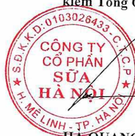
HÀ QUANG TUẤN