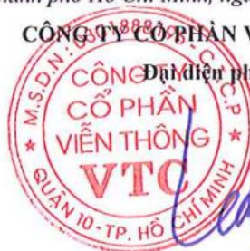
Lê Xuân Tiến

Các thuyết minh từ trang 7 đến trang 29 là bộ phận hợp thành của Báo cáo tài chính này.