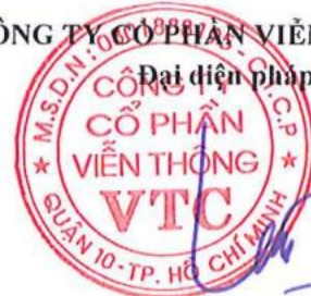
Lê Xuân Tiến

Các thuyết minh từ trang 7 đến trang 29 là bộ phận hợp thành của Báo cáo tài chính này.