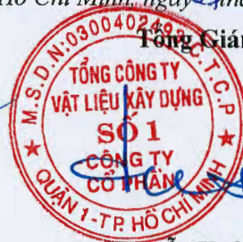
Nguyễn Xuân Thắng