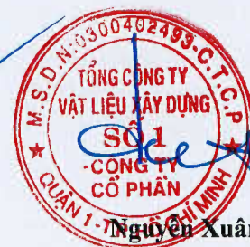
Nguyễn Xuân Thắng