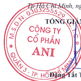
Đặng Tất Thành