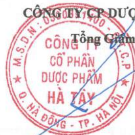
Lê Xuân Thắng

(Các thuyết minh từ trang 10 đến trang 43 là bộ phận hợp thành của Báo cáo tài chính này)