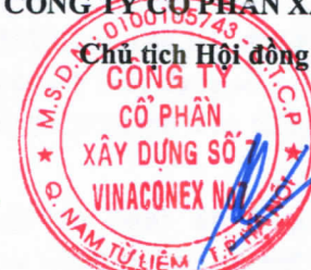
Hoàng Trọng Đức

(Các thuyết minh từ trang 10 đến trang 36 là bộ phận hợp thành của Báo cáo tài chính này)