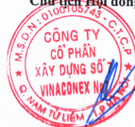
Hoàng Trọng Đức

(Các thuyết minh từ trang 10 đến trang 36 là bộ phận hợp thành của Báo cáo tài chính này)