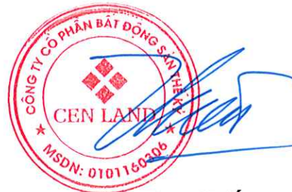
Chu Hữu Chiến