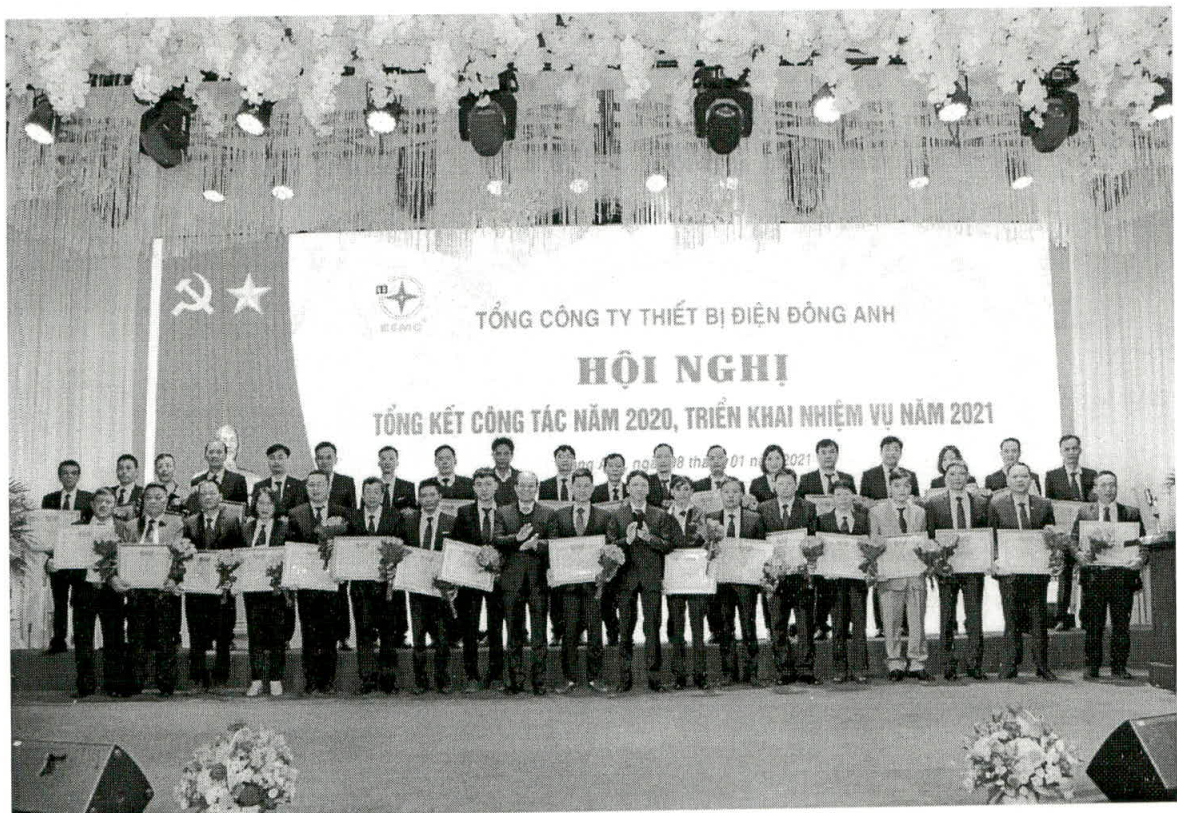
Vinh danh 36 lao động tiêu biểu đã có thành tích xuất sắc trong năm 2020