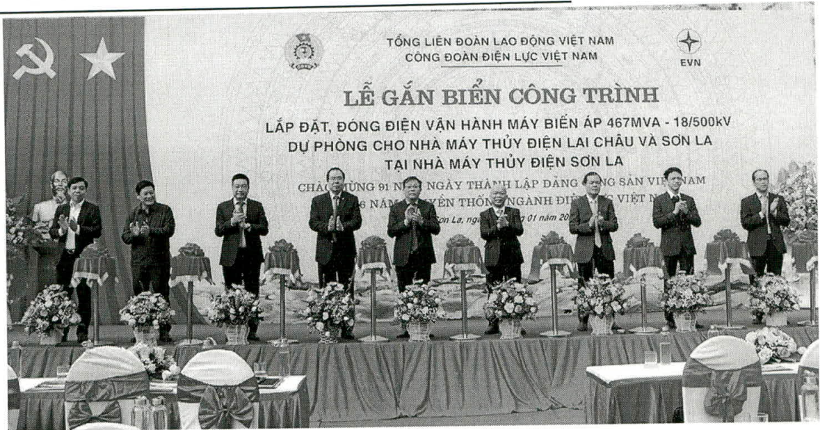
Cắt băng khánh thành công trình MBA 467 MVA – 500 kV do EEMC chế tạo và lắp đặt tại Nhà máy Thủy điện Sơn La